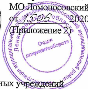
ГРАФИК приемки образовательных учреждений Ломоносовского муниципального района к 2020-2021 учебному году

УТВЕРЖДЕН Распоряжением администрации МО Ломоносовский муниципальный район от 13.06.2020 г. № 59 р/20 (Приложение 2)