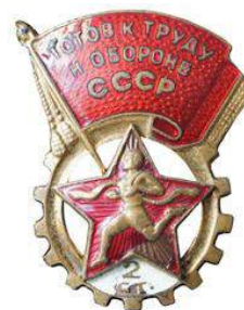
Значки ГТО I и 2 степеней 1946 – 1961 годов