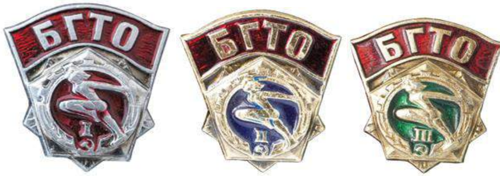
Значки БГТО I, II, III ступеней выпуска 1972 года