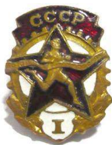
Значки «Будь готов к труду и обороне»