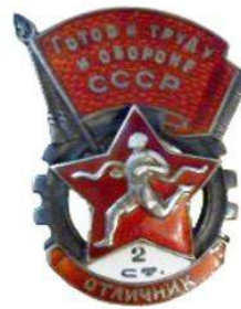
Значки «Отличник ГТО» 2 степени 1940-1946 годов (серебро и бронза)