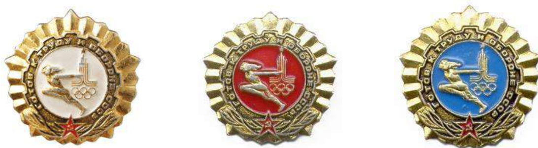
В 1980 году была выпущена специальная серия значков ГТО, посвящённая Играм XXII Олимпиады в Москве