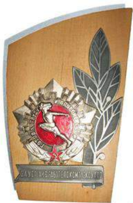
Знак «За успехи в работе по комплексу ГТО»