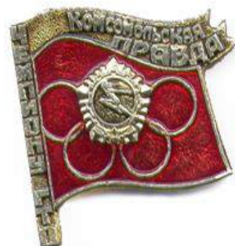
Значок «Чемпиону ГТО», Алма-Ата, 1979 год