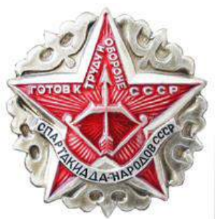
Значок региональных соревнований ГТО – Спартакиада народов СССР»