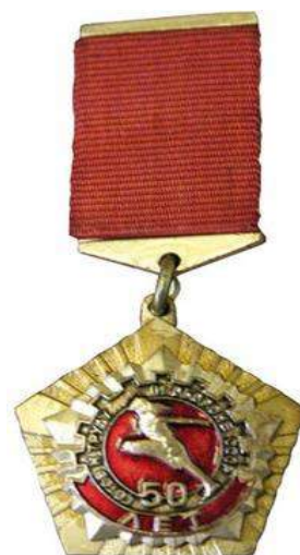
Знак «50 лет комплексу ГТО»