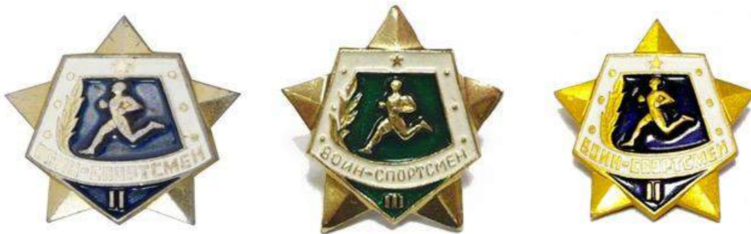
Значки «Воин-спортсмен» I, II и III ступеней, 1961 год