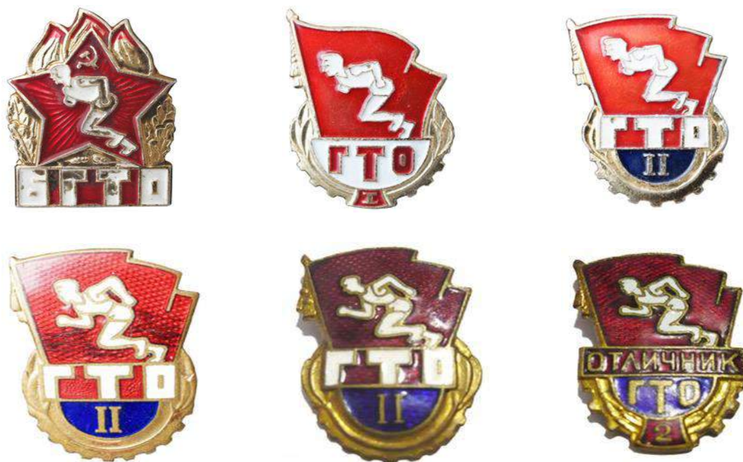
Значки БГТО и ГТО 1961 года

Обновленный Комплекс ГТО состоял из трех ступеней. Ступень БГТО - для школьников 14 - 15 лет, ГТО 1-й ступени - для юношей и девушек 16-18 лет, ГТО 2-й ступени - для молодежи 19 лет и старше.