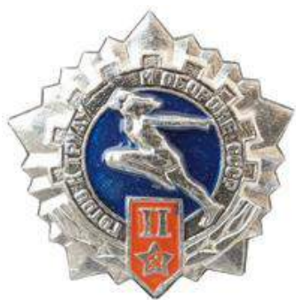
Значки ГТО в редакции 1985 года

В начале 1985 года в Комплекс ГТО был внесен очередной пакет с изменениями. Теперь комплекс для взрослых состоял из 3 ступеней, а для школьников—из 4-х.