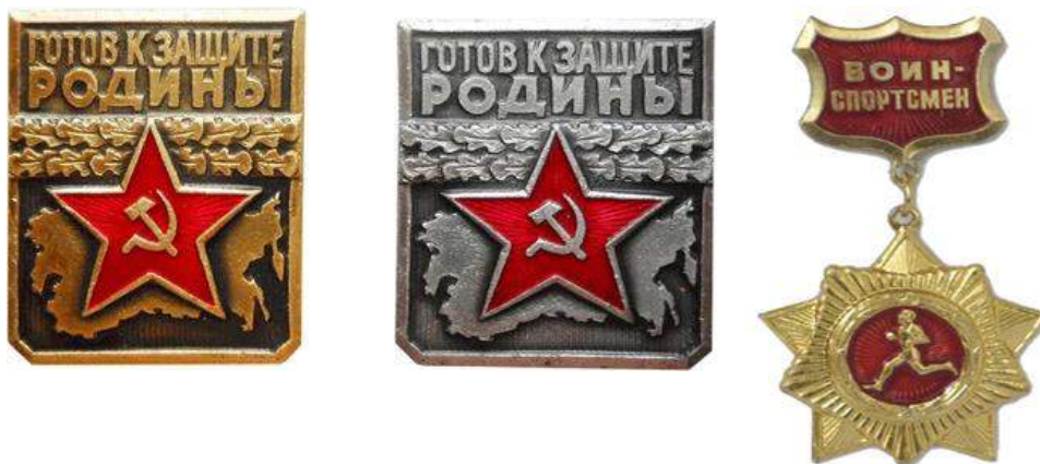
Золотой нагрудный знак «Воин-спортсмен», 1961 год

В 1966 году по инициативе ДОСААФ была разработана и введена в действие ступень комплекса ГТО для молодежи призывного возраста «Готов к защите Родины» (ГЗР).