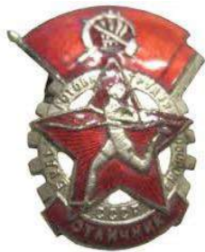
Значок ГТО 1 степени