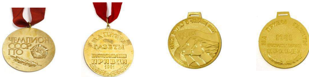
Значок и медали чемпионата СССР по многоборью комплекса ГТО на призы газеты «Комсомольская правда», Кишинёв, 1981 год