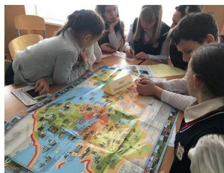
Работа над созданием Краеведческого Атласа Ломоносовского района