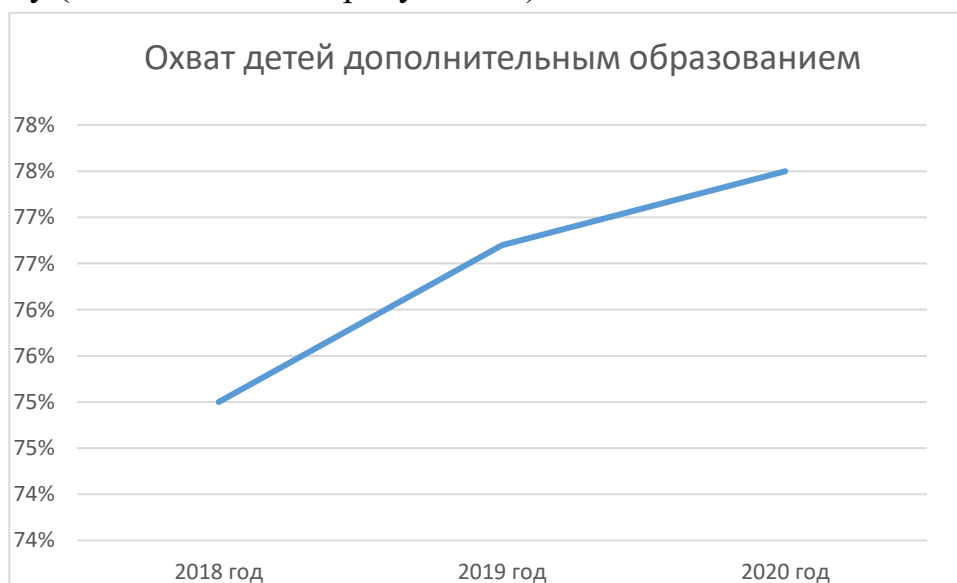
Рис. 1. Охват детей дополнительным образованием.

Доля детей, охваченных дополнительными общеобразовательными программами, от общего числа детей от 5 до 18 лет, проживающих на территории Ломоносовского района, последовательно растёт с 75% в 2018 году до 77,5% в 2020 году (в соответствии с рисунком 1).