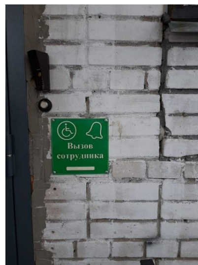
Кнопка вызова сотрудника