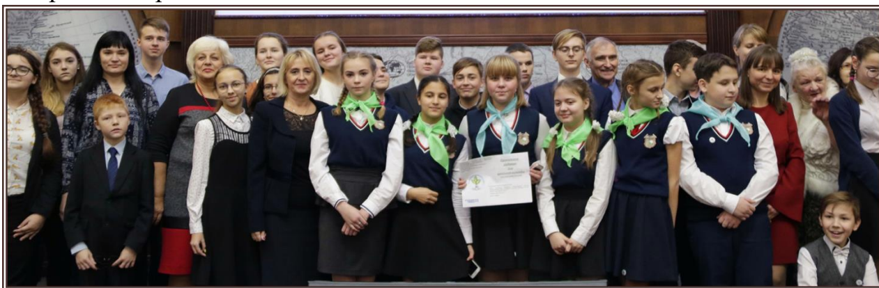
Торжественное открытие ЛАЕНИ. Русское географическое общество. Санкт-Петербург

В 2019 году команды школ участвовали в подготовке материалов для создания иллюстрированного краеведческого атласа Ломоносовского района Ленинградской области, а затем выступили в роли экспертов, оценив макет атласа, внесли предложения по содержанию и оформлению Атласа, по наполнению его электронного приложения. Атлас вышел в конце 2019 года.