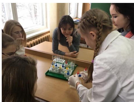
Занятия по гидрохимии. Зимняя сессия ЛАЕНИ