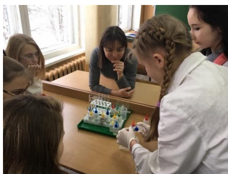
Занятия по гидрохимии. Зимняя сессия ЛАЕНИ