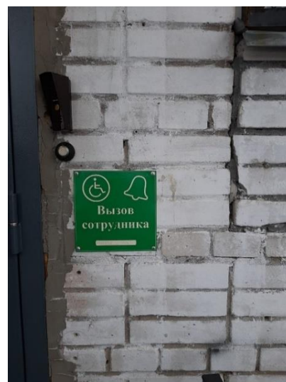
Кнопка вызова сотрудника