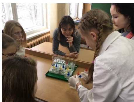
Занятия по гидрохимии. Зимняя сессия ЛАЕНИ