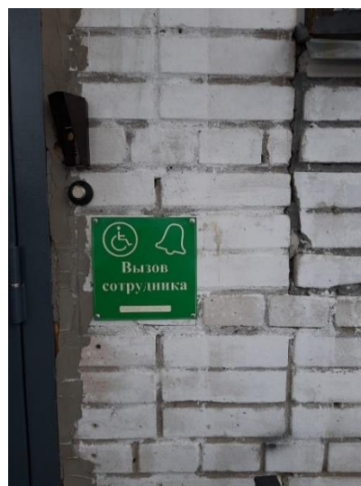
Кнопка вызова сотрудника