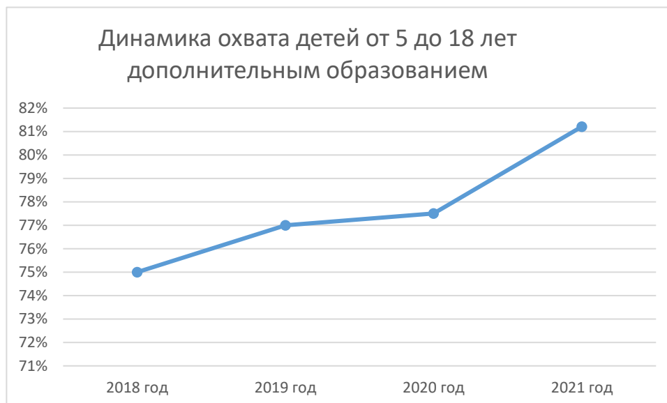
Рис. 1. Динамика охвата детей дополнительным образованием, 2018-2021г.г.

Доля детей, охваченных дополнительными общеобразовательными программами, от общего числа детей от 5 до 18 лет, проживающих на территории Ломоносовского района, последовательно растёт с 75% в 2018 году до 88,21% в 2021 году (в соответствии с рисунком 1).