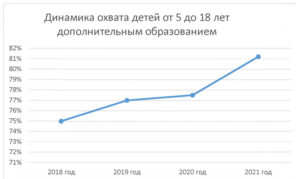
Рис. 1. Динамика охвата детей дополнительным образованием, 2018-2021г.г.

Доля детей, охваченных дополнительными общеобразовательными программами, от общего числа детей от 5 до 18 лет, проживающих на территории Ломоносовского района, последовательно растёт с 75% в 2018 году до 88,21% в 2021 году (в соответствии с рисунком 1).