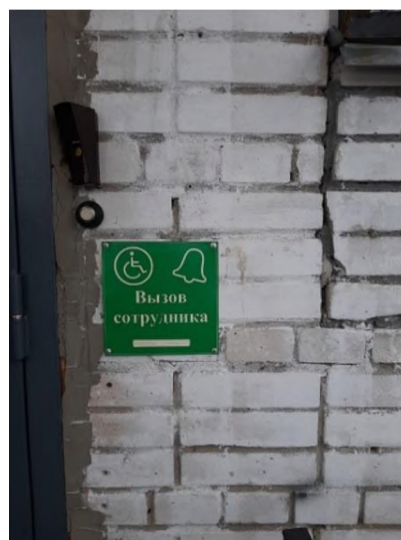
Кнопка вызова сотрудника