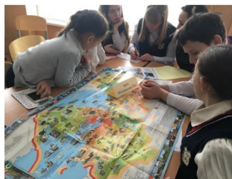
Работа над созданием Краеведческого Атласа Ломоносовского района