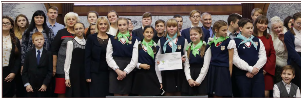
Торжественное открытие ЛАЕНИ. Русское географическое общество. Санкт-Петербург