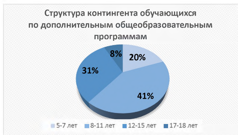
Рисунок 2 – Возрастная структура контингента обучающихся по дополнительным общеобразовательным программам (на декабрь 2020 года)

На основе анализа данных АИС «Навигатор» можно представить структуру контингента обучающихся по дополнительным общеобразовательным программам в учреждениях дополнительного образования, подведомственных Комитету по образованию.